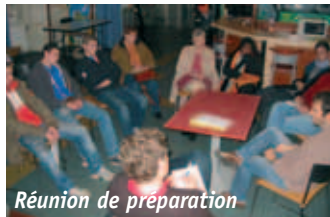
Réunion de préparation

les 14-17 ans sont prompts à partager un « bon plan » avec leurs copains ! Le principe : en échange d'un peu de temps libre consacré au chantier citoyen, ils ont la possibilité de choisir un séjour vacances, ou des sorties loisirs ponctuelles. Le tout proposé à un coût modéré, dans une optique d'action populaire chère à la philosophie de la MJC.